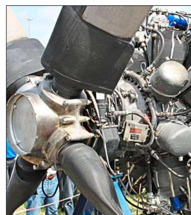
Mit diesem Antrieb von Pratt und Whitney geht man in die Luft.