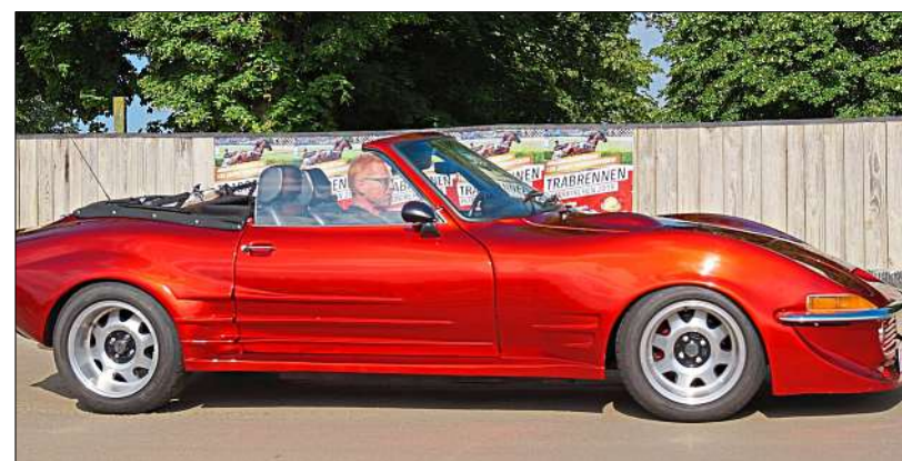
Pferdestärken passen bestens auf die Trabrennbahn Pfarrkirchen.