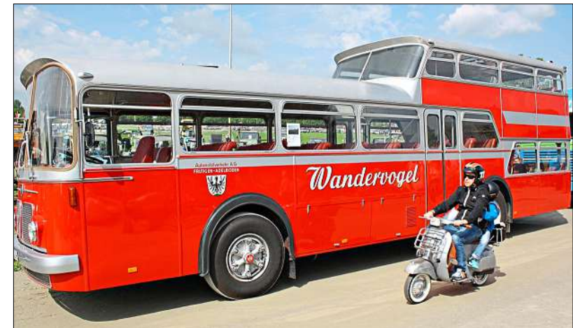
Personentransport im Jahre 1969 mit dem FBW-Vetter-Bus.