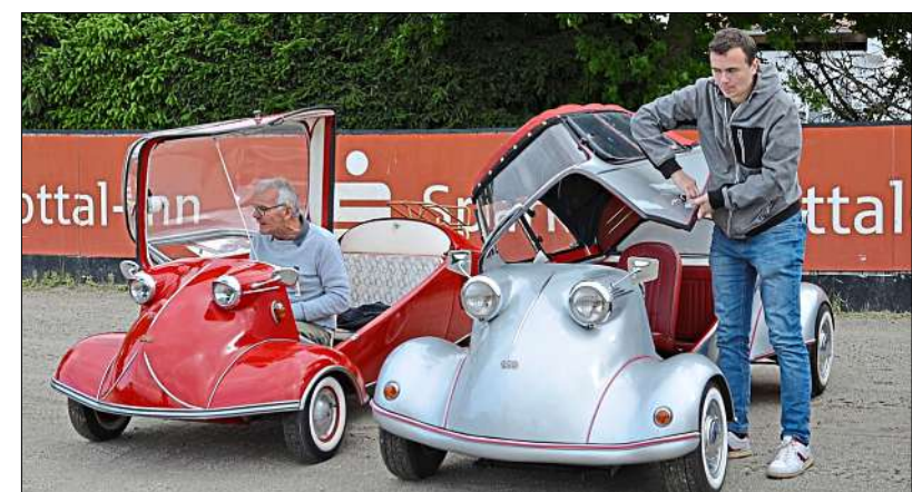
Klein aber oho: Oldtimer der anderen Art beim letzten Treffen 2025.