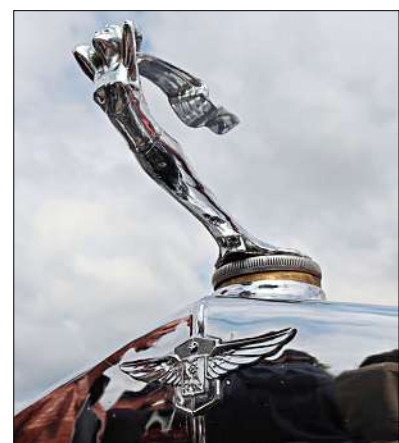
Cadillac-Kühlerfiguren gibt es auch immer wieder zu bestaunen.