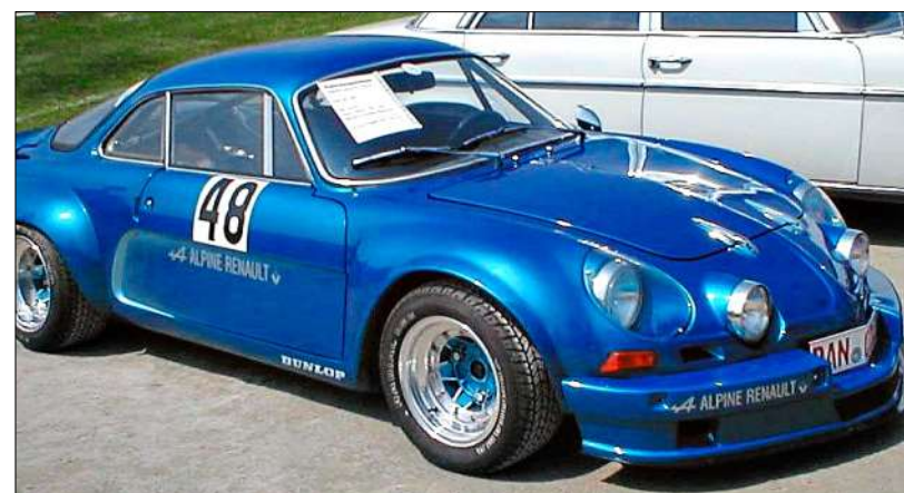
Dieser Renault Alpine zählte zu den historischen Fahrzeugen der frühen Oldtimertreffen.