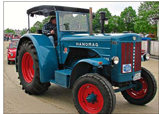
Landwirtschaftliche Fahrzeuge werden immer im Osten der Rennbahn aufgestellt.