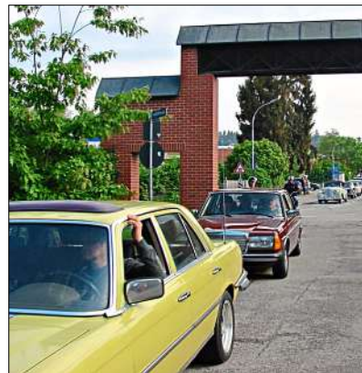
Um Staus zu minimieren, herrscht seit 2013 beim Oldtimertreffen eine Einbahnregelung.