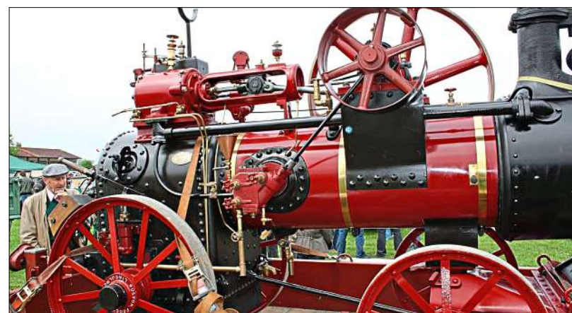
Eine historische Dampfdreschmaschine , die an die Feldarbeit anno dazumal erinnert.