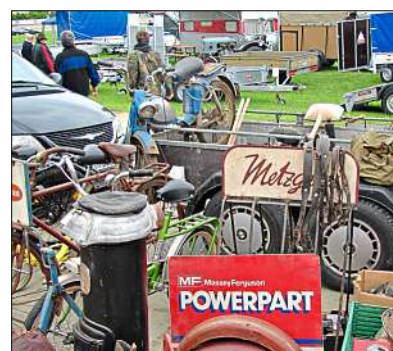
Der Teilemarkt – hier 2010 – ist bis heute beim Treffen ein beliebter Anlaufpunkt.