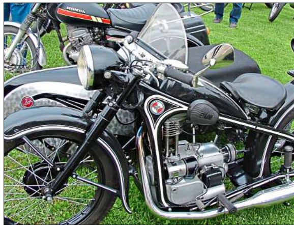
Auch Fans heißer Öfen kommen auf ihre Kosten wie hier im Jahr 2010.