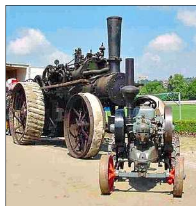
Beim ersten Treffen vor 25 Jahren war dieser Feldpflug aus dem 19. Jahrhundert mit dabei.