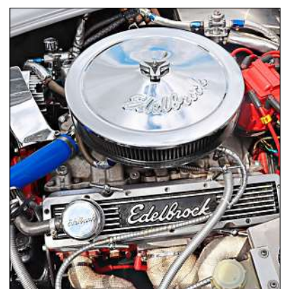
Hingucker: Edelbrock-Motor in einem AC Cobra von 1974 mit 5700 ccm.