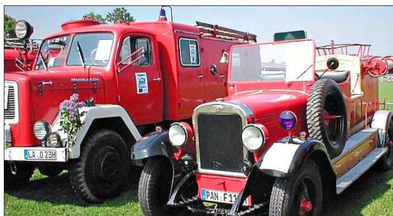
Von Anfang an gehörten Feuerwehr-Fahrzeuge mit dazu wie hier im Jahr 2005.