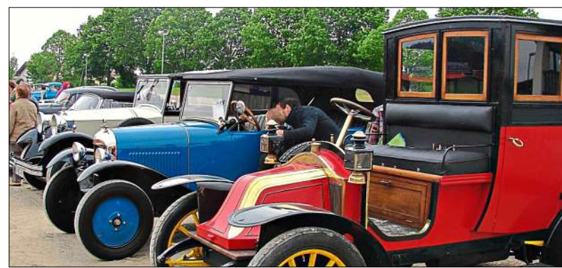
Eine Reihe altehrwürdiger Oldtimer wie hier beim Treffen im Jahr 2010 auf der Rennbahn.