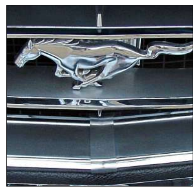
Um Marken und Modelle geht es wie hier bei diesem Ford.